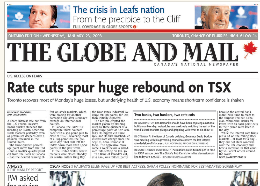
Source: The Globe and Mail, 23 janvier 2008

« Les marchés haussiers naissent du pessimisme, se développent dans le scepticisme, mûrissent dans l'optimisme et meurent dans l'euphorie. »